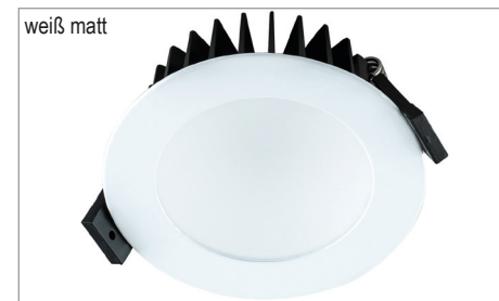
L54N150125 15W Leuchte mit Netzgerät